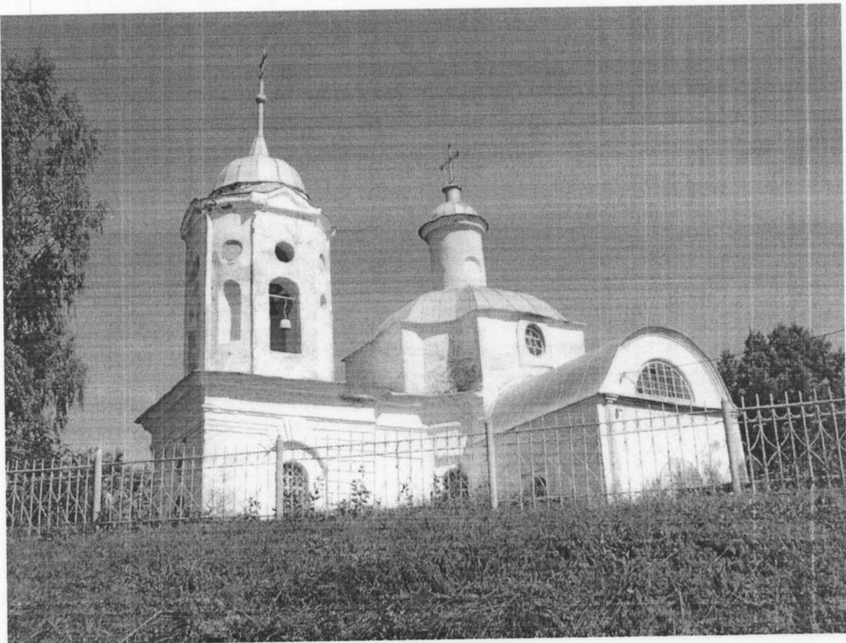
Церковь Дмитрия Солунского (1780 г.) с. Старое Задубенье Унечского района

Фотографическое изображение объекта культурного наследия, за исключением отдельных объектов археологического наследия, фотографическое изображение которых вносится на основании решения соответствующего органа охраны объектов культурного наследия